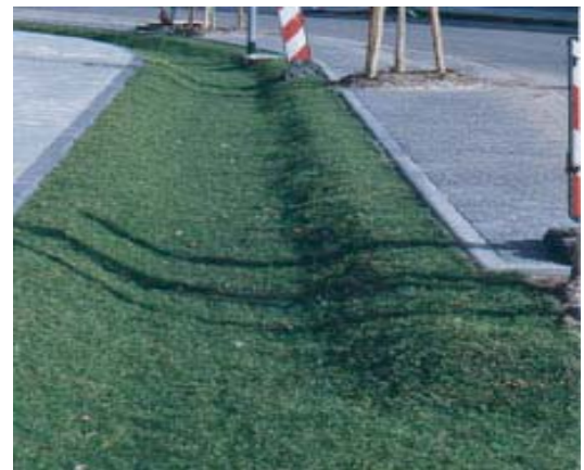
Berlin Adlershof: ausgeführte straßenparallele Versickerungsmulde

Entwässerungskonzept: Geplant wurde ein Qualifiziertes Trennsystem mit einer Reinigung von stärker verschmutzten Niederschlagsabflüssen in Bodenfilteranlagen und einer Versickerung und Ableitung von gering verschmutzten Abflüssen. Die hydrologisch-hydraulische Leistungsfähigkeit sowohl der Versickerungsmaßnahmen als auch des Kanalnetzes war mittels Langzeitsimulation nachzuweisen. Für die Verkehrsflächenentwässerung wurden straßenparallele Versickerungsmaßnahmen vorgesehen.